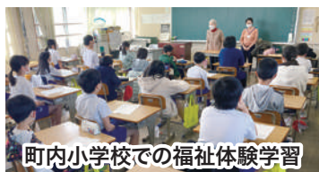
町内小学校での福祉体験学習

地域福祉の主役である住民のみなさまと一緒に、魅力ある久御山町の福祉活動を行えるよう、社協会員として財政面で地域の福祉活動に参加いただける方を募集します。