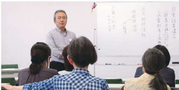
講義のあとは時間が許す限り相談会。「こんな場合はどうすれば？」と受講者からの質問が寄せられる。