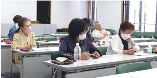
講師自身の経験も交えながらのわかりやすい説明に、メモを取る受講者。