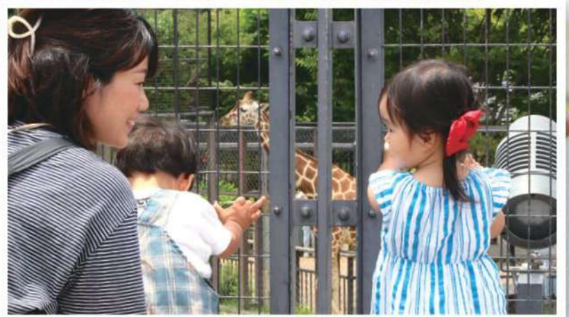
表紙：親子ニコニコ子育てサロン（裏表紙）