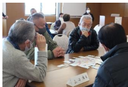
<グループワークの様子>

今後も研修を計画しています。災害関係の研修は何度参加しても色々な知識を吸収できる内容ですので、次回もたくさんの方の参加をお待ちしております。