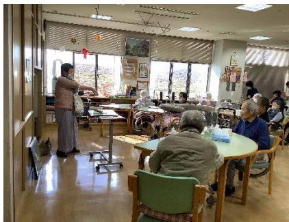
<デイサービスの紙芝居の様子>