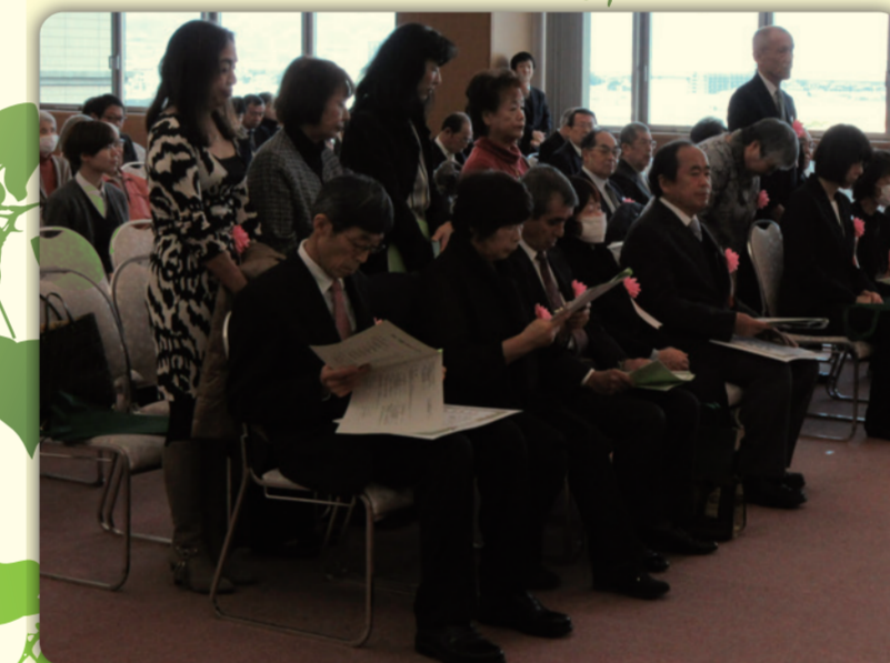
第19回久御山町社会福祉大会

発行 久御山町社会福祉協議会/ボランティアバンク運営委員会 〒613-0043 京都府久世郡久御山町島田ミスノ11 番地 TEL 075-631-0022 FAX :075-632-3001 HPアドレス http://www.kyoshakyo.or.jp/kumiyama/ E-mail kumishakyo@poem.ocn.ne.jp