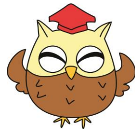
見守りネット キャラクター