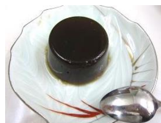
コーヒーかんてん