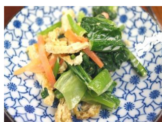
小松菜のからしマヨネーズ和え