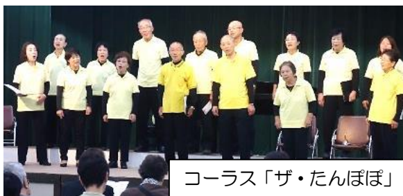
コーラス「ザ・たんぽぽ」