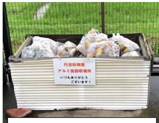
丹波桜梅園のカゴ (ほほえみ内)

京丹波町内には、アルミ缶回収の場所が多く設けられています。丹波桜梅園や京丹波町共同作業所の利用者が回収されています。