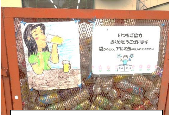
作業所本所前のカゴ (須知区)