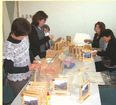
▲小学生卒業御祝贈呈

今年は卒業記念として各学校の写真と校歌を写真立てに入れ贈りました。みんな笑顔で受け取っていただきました。