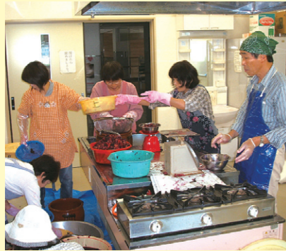
▲手作り梅干し配布

民生委員さんの手作り梅干を今年も美味しく頂戴いたしました。毎年この梅干を楽しみにしています。ありがとうございます。