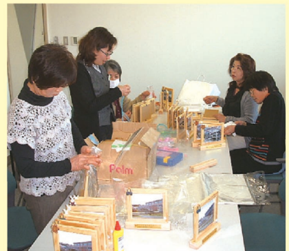
▲小学生卒業御祝贈呈

今年は卒業記念として各学校の写真と校歌を写真立てに入れ贈りました。みんな笑顔で受け取っていただきました。