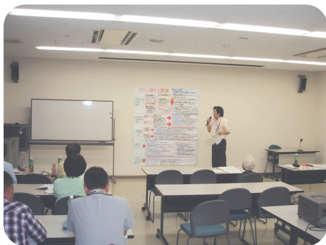
▲ふれあい・いきいきサロンのちから～可能性～