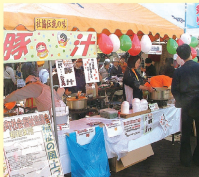
▲「ふれあい福祉まつり」出店

共同作業所の自主製品販売や豚汁の販売を通して、『福祉』をより身近に感じてもらうことができました。