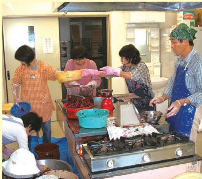
▲手作り梅干し配布

民生委員さんの手作り梅干を今年も美味しく頂戴いたしました。毎年この梅干を楽しみにしています。ありがとうございました。