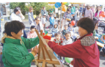
ファミサポ・エプロンシアター