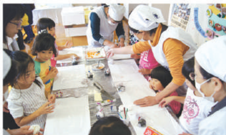
くるみの会おにぎり体験コーナー