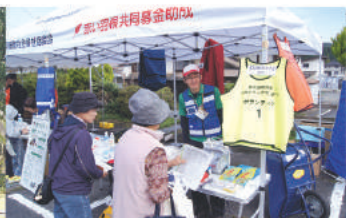
災害ボランティアコーナー