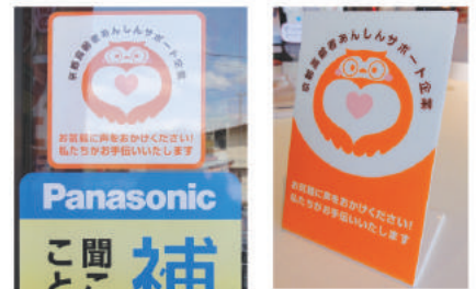
このプレートやステッカーが「あんしんサポート企業」の目印です

☆地域の中で見守りをしていただく中で、気になる方がおられたり、出来事があった時は、社会福祉協議会までご相談・ご連絡下さい。