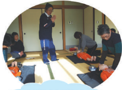
日赤幼児安全法指導員による救急救命講習