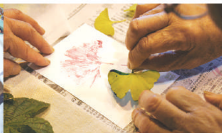
彩り染め体験コーナー