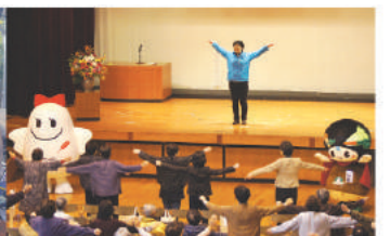
みんなでラジオ体操