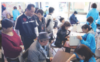
保健福祉課の健康増進コーナー