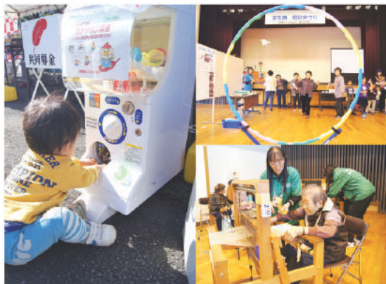
共同募金ガチャガチャ ④紙飛行機 ⑤さをり織り