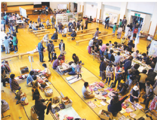
会場は多くの来場者で賑わいました

主催 福祉まつり実行委員会(京丹波町社会福祉協議会 京丹波町社協ボランティアバンク運営委員会) 後援 京丹波町 京丹波町健康づくり推進協議会