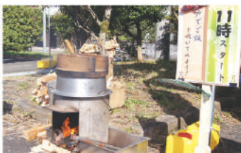
かまどご飯の試食