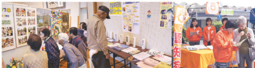
こここクラブ活動展示 事業所紹介コーナー 認知症啓発コーナー