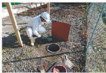
ボランティアルーム(須知)のマンホールのフタ設置。

おかげさまで、社協の施設を利用いただく多くの住民のみなさまに、安全に安心して使っていただくことができるようになりました。本当にありがとうございました。