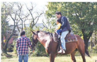
キッズ乗馬体験コーナー

次 世代へつなごう ふくしの心をテーマに第5回目となる福祉まつりを開催しました。 秋晴れの好天のもと、福祉まつり関係者を含め、500名以上の参加をいただき、盛大に開催する事が出来ました。 オープニングは京丹波町ファミリー・サポート・センター会が歌で会場を盛り上げました。式典ではボランティア表彰の後、保健福祉課によるラジオ体操で運動の大切さを実感する時間となりました。 今回は午後から会場を仕切り、各種の体験コーナー等を取り入れられました。初めての取り組みでしたが、子どもから大人まで笑顔あふれる場面が見られました。ご協力いただきました関係者、地域の皆様にお礼申し上げます。ありがとうございます。