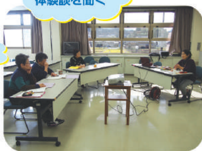
活動会員による体験談を聞く

最終の講座の時もお互いの気持ちや世の中の時事問題など多様な話が出て、受講生のファミサポや子育てについて積極的に関わろうという姿勢が頼もしく感じられました。