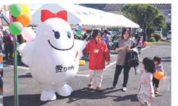
共同募金コーナー