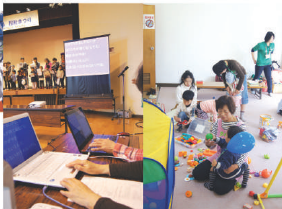
要約筆記のご協力