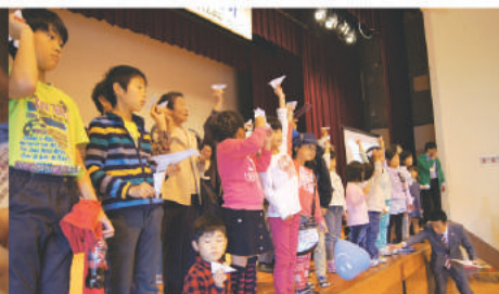
エンディングに紙ヒコーキを飛ばしました

《瑞穂地区》 押し花ボランティア「花かご」 《丹波地区》 押し花ボランティア「すずらん」 《丹波地区》 絵手紙ボランティア