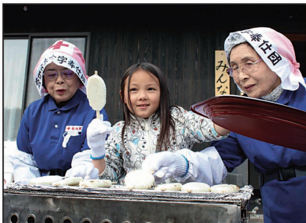
熊本県熊本市/赤十字奉仕団による炊き出し

これらの活動をいっそう推進していくためには、多くの資金が必要です。5月1日より自治会・町内会をつうじて活動資金の募集を行います。ご協力よろしくお願いたします。また大口の寄付につきましても募集しております。