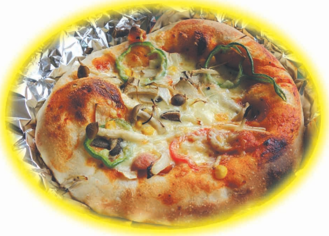
竹野小学校 パン焼き窯