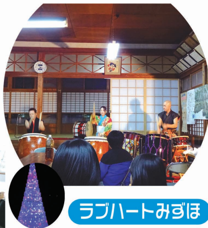
ラブハートみずほ