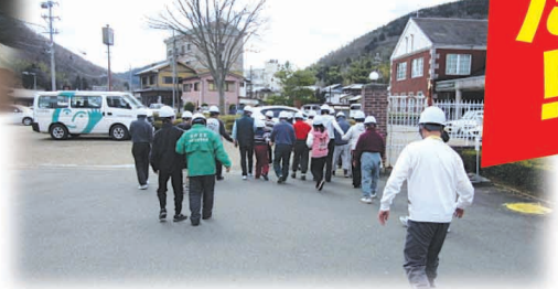
※落ち着いて避難場所まで移動。