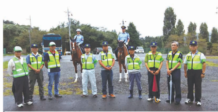
地域の自主防犯活動

みんなで大きな大きな花火に見入りました。その後はやぐらを囲み、文七踊りに興じました。