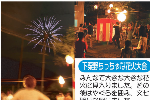
下粟野ちっちゃな花火大会

みんなで大きな大きな花火に見入りました。その後はやぐらを囲み、文七踊りに興じました。