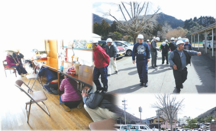
※まずは机の下に避難。