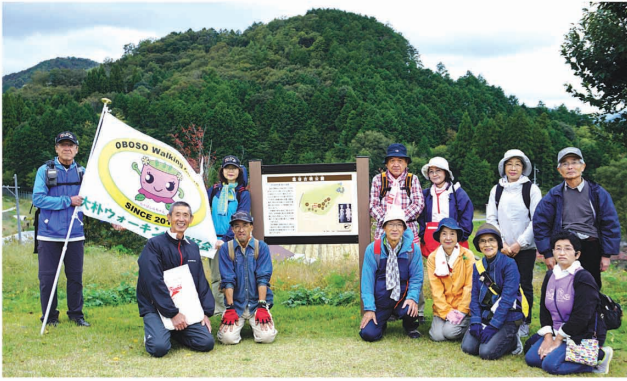
大朴ウォーキング同好会

町民の皆さまから寄せいただいた赤い羽根共同募金を活用し、地域の課題解決や住みよい町づくりのために住民主体で取り組む活動を応援する助成事業を実施しています。