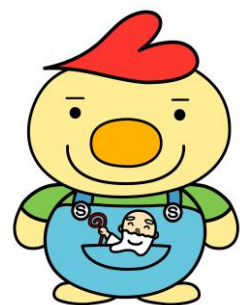
社協キャラクター こたん