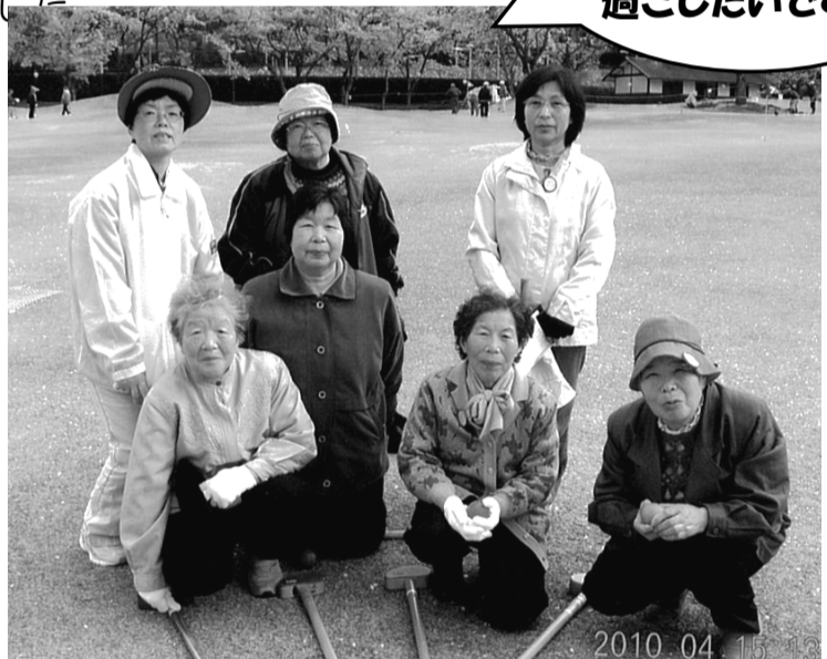
●坂井ふれあい・いきいきサロンより