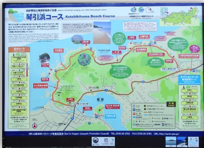
「琴引浜コース」紹介パネル コース全体が理解できます