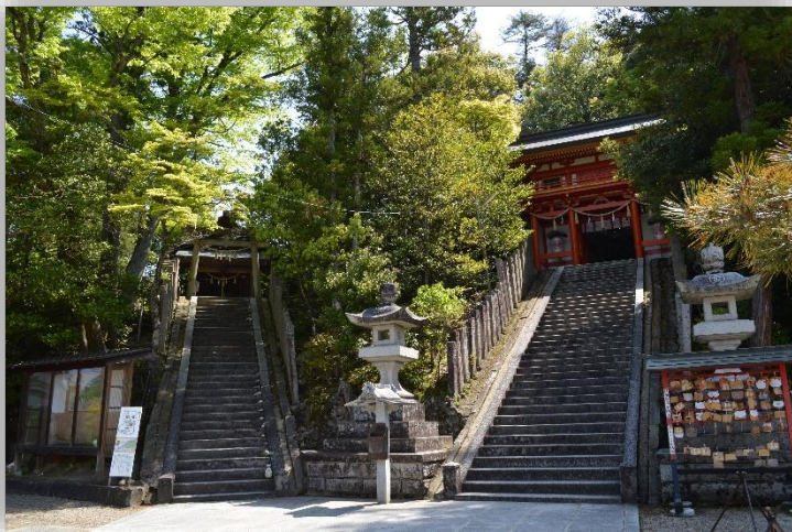
石段下からの風景

「亀の池」の側にあるベンチに腰掛けて亀たちの動きを見ているといつまでもあきずに見られます。