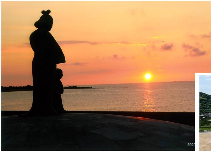
はしうど皇后と聖徳太子が 日本海に沈む夕日を眺めているよう

おすすめコースは、先ず立岩を眺め、はしうど皇后と聖徳太子の母子像を散策、その後、大成古墳群と展望台へ、そして屏風岩、犬ヶ崎トンネルを越えると、丹後松島が眺められるポイントがあります。そのまま宇川方面へ進み、此代の花畑、久僧の海岸です。