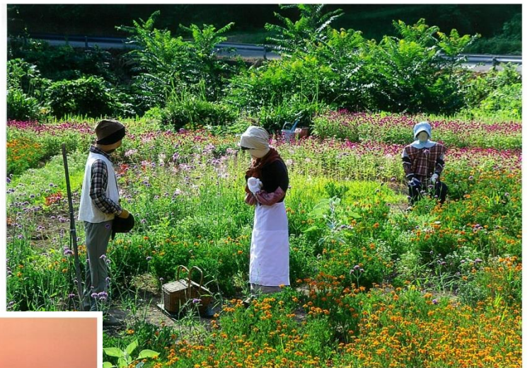
此代に広がる花畑