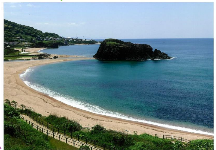
大成古墳群の展望台から遊歩道を下りたところ