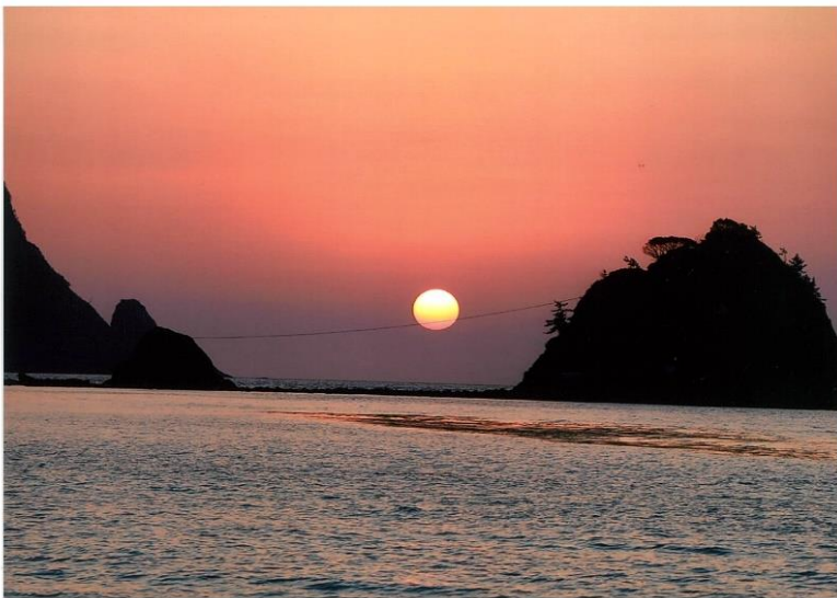
久僧の海岸からみる夕日