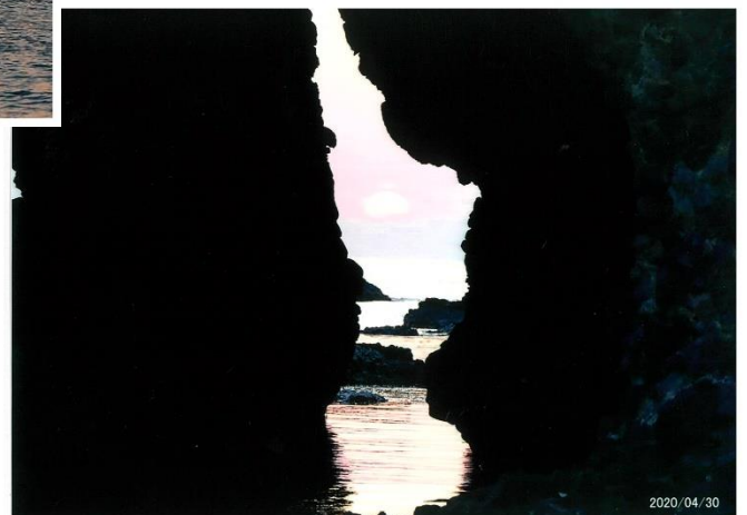
岩をつかって沈む夕日を覗いてみました