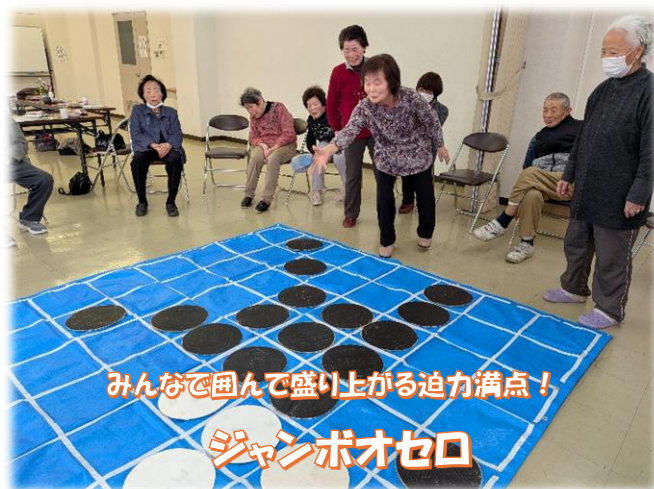
みんなで囲んで盛り上がる迫力満点！ ジャンボオセロ