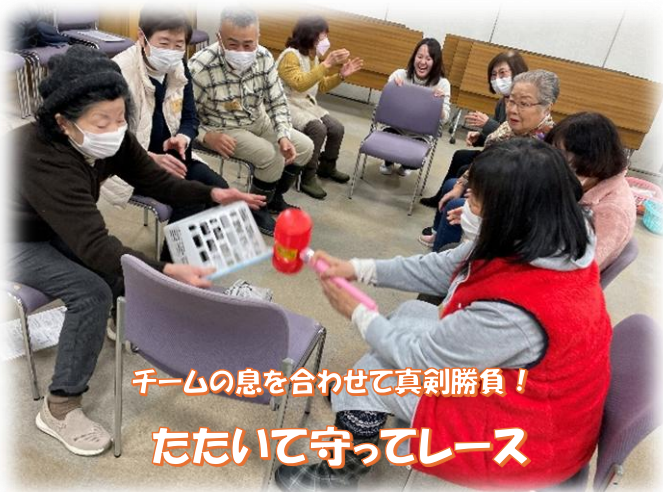
チームの息を合わせて真剣勝負！ たたいて守ってレース