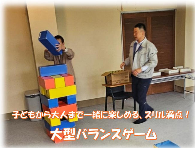
子どもから大人まで一緒に楽しめる、スリル満点！ 大型バランスゲーム