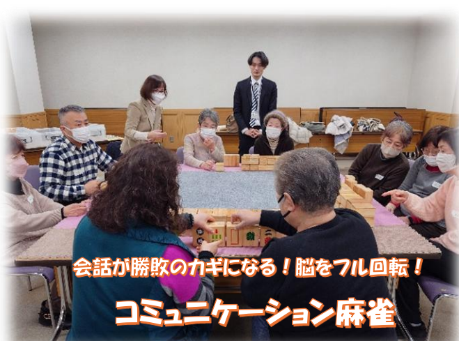
会話が勝敗のカギになる！脳をフル回転！ コミュニケーション麻雀