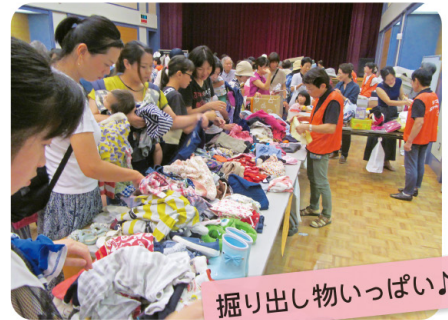
掘り出し物いっぱい!

ボランティア同士の交流とボランティア活動の資金確保を目的に毎年8月に開催しています。令和元年度は約300名の方が来場されました。バザーはもちろん、飲食コーナーやキッズコーナーも大好評でした。令和2年度の開催については、コロナウイルスの関係もあり、現在のところ未定です。詳細が決まり次第お知らせします。