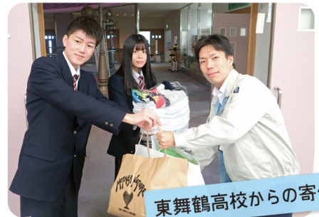
東舞鶴高校からの寄付

福祉施設で綿布が不足しているとの声を聞き平成27年度から毎年2回実施しています。誰でも気軽に始められる寄付するボランティアです。令和2年度も6月下旬と11月下旬に実施予定です。