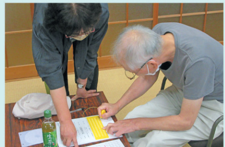
点字を体験する様子