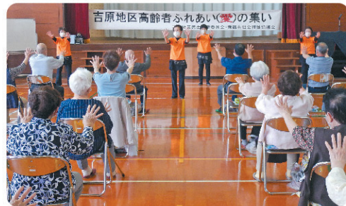
高齢者ふれあい(愛)の集い