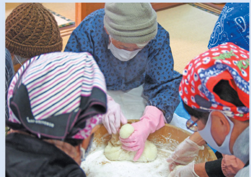
高齢者世帯へのお餅配り事業の様子