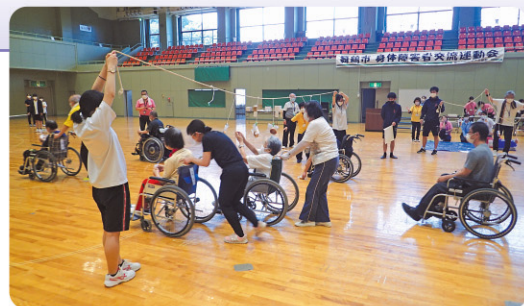
身体障害者団体連合会主催の交流運動会