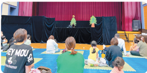
民児協と社協による 子育ての集い