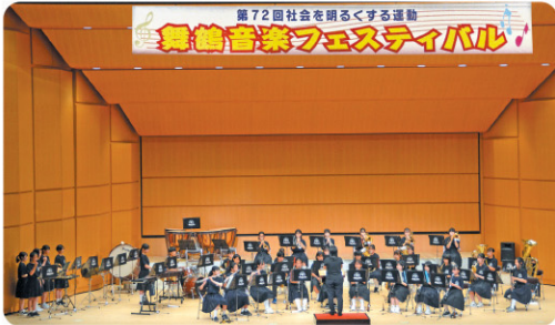
社会を明るくする運動 舞鶴音楽フェスティバル