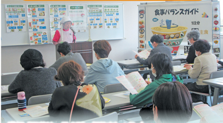
講師「野菜は一日 350g 摂りましょう。」