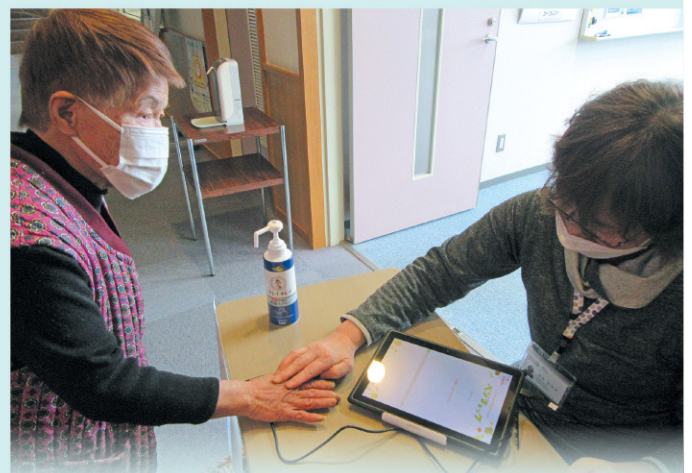
ベジチェックで野菜摂取量測定 ※ベジチェックはカゴメの登録商標です。