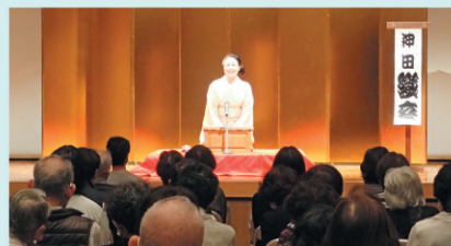
講演を聞き入る参加者

参加者からは、「講義と違い、難しい制度について、わかりやすく、楽しく学ぶことができました。」「自分の親のことを考えるよい機会となった。」などの感想をいただきました。