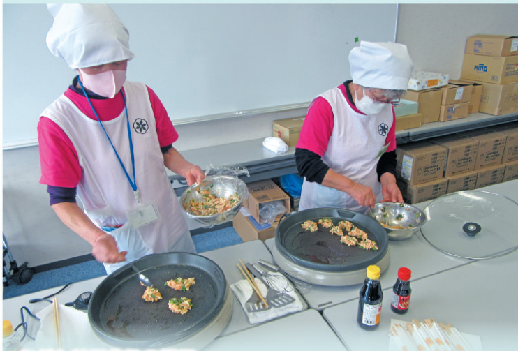
うどん餃子作りの様子