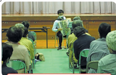
民生児童委員協議会との協働事業