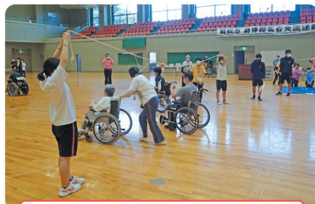
舞鶴市身体障害者交流運動会