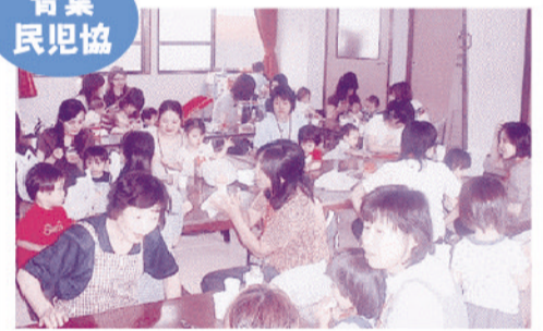
セタニコニコ子育ての集い