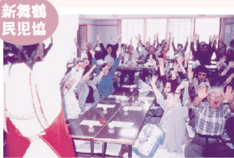
一人暮らし高齢者「ふれあいの集い」