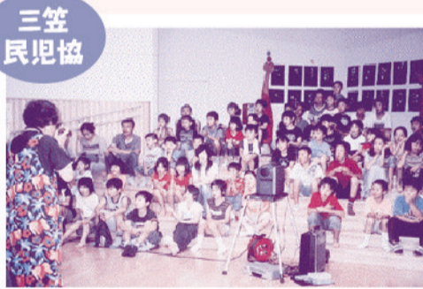
夏休み たそがれ映画会