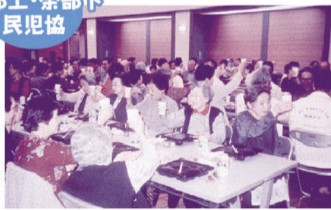
一人暮らし高齢者「花見の集い」