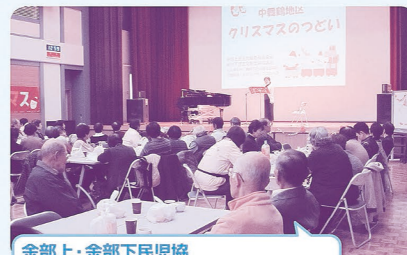
余部上・余部下民児協 「中舞鶴地区高齢者クリスマスのつどい」