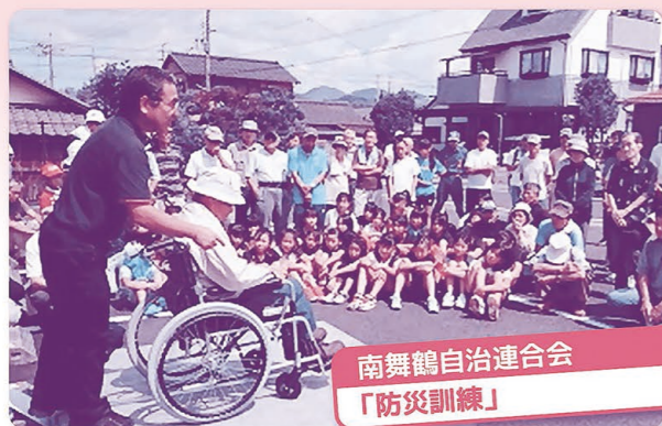
南舞鶴自治連合会 「防災訓練」