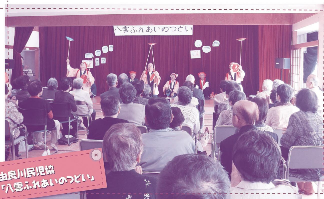
由良川民児協 「八雲ふれあいのつどい」

立ち上げまでの相談支援を行い、初日に市の保健師と一緒に参加し、様子をうかがわせていただきました。