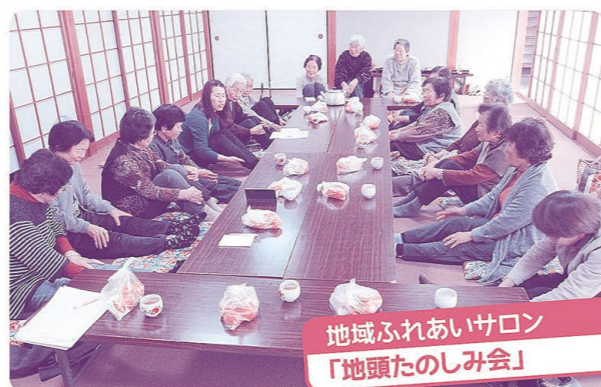
地域ふれあいサロン 「地頭たのしみ会」

舞鶴警察署から講師をお招きし、安全運転に関する講座を開催、あらためて運転に対する意識を高めました。