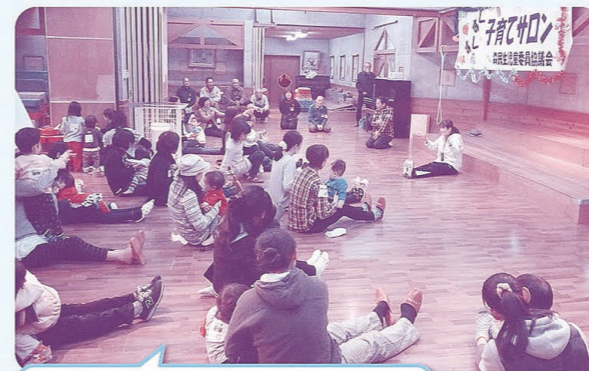
森民児協 「すくすく子育てサロン」

高齢者、障がい者、子育て家庭などの孤立化を防ぎ、小地域における住民主体の見守り、支えあい、生活の質の向上を図るため、各地域の民生児童委員協議会の皆さんとの事業に取り組んでいます。