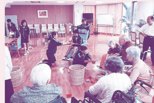
アザレア舞鶴での職業体験(和田中学校)

将来、福祉職に関心または就業する人材を養成する目的で、小・中学校の総合学習の時間を活用し、福祉についての学習や、施設での職業体験を行う「次世代の担い手育成事業」を、昨年度に引き続き、倉梯第二小学校、和田中学校で行っています。