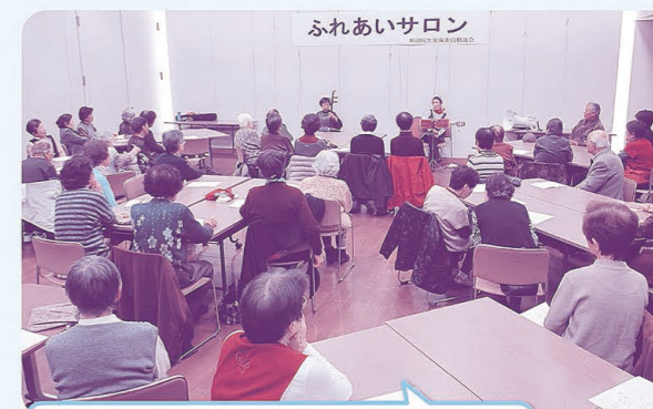
田辺民児協 「高齢者ふれあいサロン」