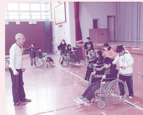
車椅子体験(倉梯第二小学校)

施設の職員や障がいをもつ当事者のお話しには熱心に聞き入り、また、施設での職業体験では、様々な職種の方が「笑顔」で働かれている姿に感動しました。