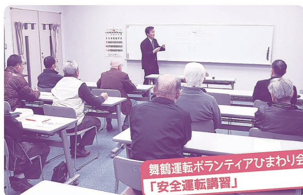
舞鶴運転ボランティアひまわり会 「安全運転講習」

舞鶴警察署から講師をお招きし、安全運転に関する講座を開催、あらためて運転に対する意識を高めました。