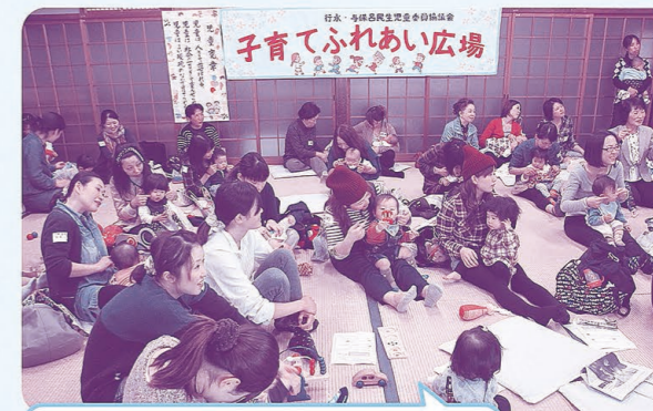
行永民児協 「子育てふれあい広場」