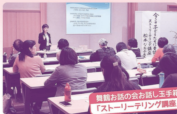
舞鶴お話の会お話し玉手箱 「ストーリーテリング講座」