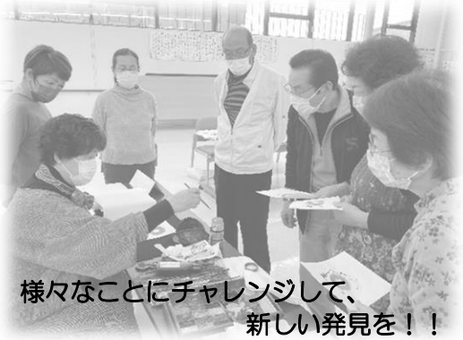
様々なことにチャレンジして、新しい発見を！！

まだまだ寒い日が続いていますが、花のつぼみも膨らみ始め、春は確実に近づいているようです。コロナは、まだまだ一人ひとりの心がけが大切となる日々が続きます。たまには、美味しい物を沢山食べたり、好きな音楽を聞きながら大きな声で歌ったり、我慢だけではなく、好きな事・楽しい事もバランスよくして、大変な時期をみんなと一緒に乗り切りましょう！