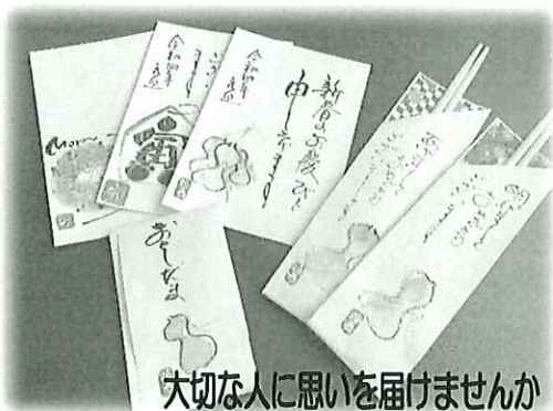
大切な人に思いを届けませんか

・結びのつどい(第二回)「一筆画教室」 十一月十八日(木)午後一時～ 保健福祉センター 参加費…二〇〇円 対象者…村在住の方