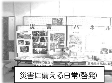
災害に備える日常(啓発)