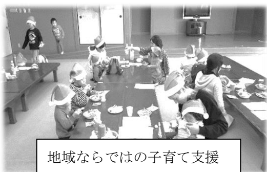
地域ならではの子育て支援

毎年みなさまからお寄せいただく一般会費は、これらの活動を支える貴重な財源となっています。また、会費の40%に均等割を加算した額を支部活動に還元し、ふれあいサロン、要援護者の集いなど、地域でのこまやかな自主活動に活用していただいています。これらの活動にご賛同いただき、会員としてご加入いただくことは、社協を応援していただき、地域福祉活動に参加していただくひとつの方法です。一般会員ご加入に住民のみなさまのご理解とご協力をお願いします。