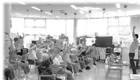
高齢になってもいきいきと暮らせる場所づくり