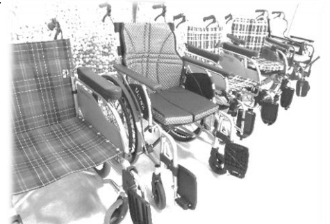
車椅子やポータブルトイレの貸し出しもおこなっています