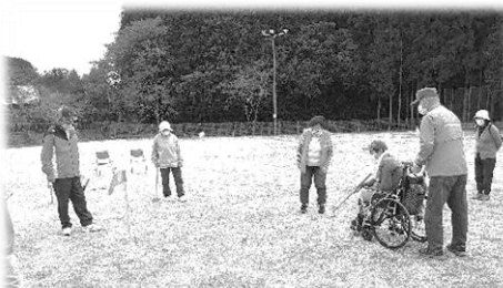
障がいのある方とボランティアとのふれあい