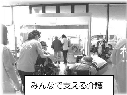
みんなで支える介護