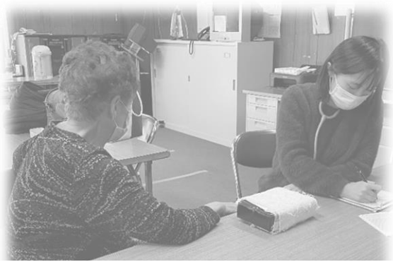
「体調はどうですか？」血圧等の測定の後、お話を聞きながら、健康手帳にしっかり記録します

※新型コロナウイルスの感染拡大の影響により電話相談に変更させていただく場合があります。