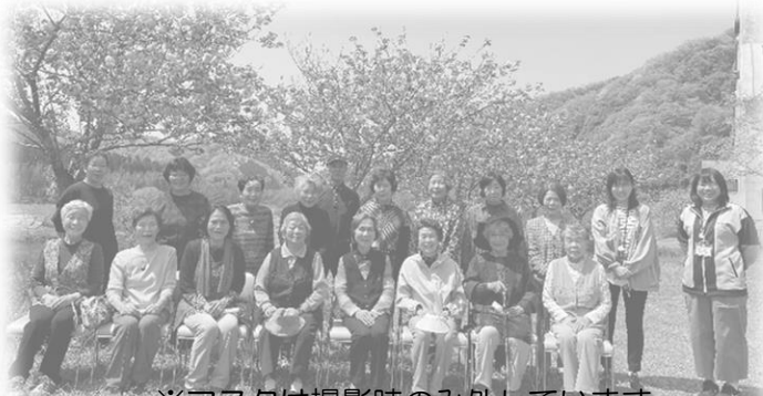
※マスクは撮影時のみ外しています