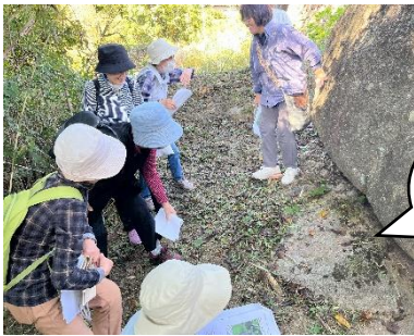
かくれ地蔵をのぞいています

さわやかな過ごしやすい季節になりました。先日、〈本郷ニコニコ会〉で本郷周辺の歩こう会が行われ、かくれ地蔵や大河原宿、春光寺を案内してもらいながら歩きました。知らないことがたくさんあり、勉強になりました。