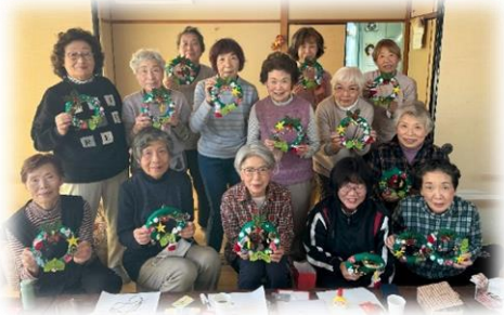
本郷ニコニコ会（第3水曜日）

また、みなさんも地域の中でふれあい・いきいきサロンを開催してみませんか？サロンの立ち上げ、運営についてのご相談は、社協までお気軽にお問合せください。