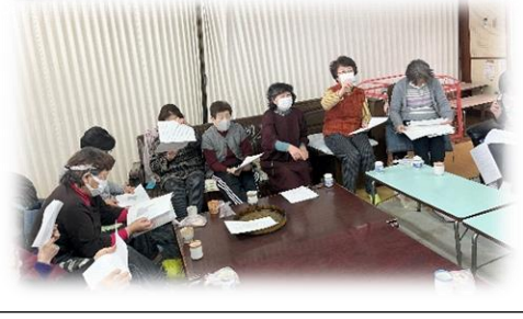
月ヶ瀬NTいきいき元気広場の会（第2・4月曜日）