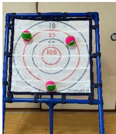
ターゲットゲーム