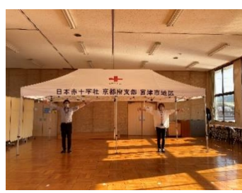
ワンタッチテント (3m×6m)