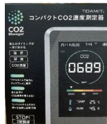
CO2 測定器 (3セット)