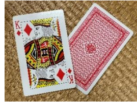
ジャンボトランプ (17cm×11cm)