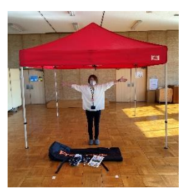
ワンタッチテント (3m×3m)