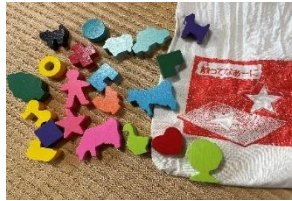
さわってなあーに