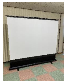
スクリーン (100インチ)