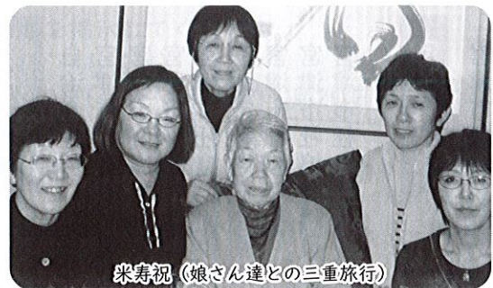
米寿祝 (娘さん達との三重旅行)