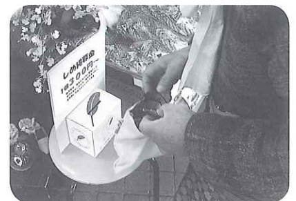
募金箱設置(宮津市社協)