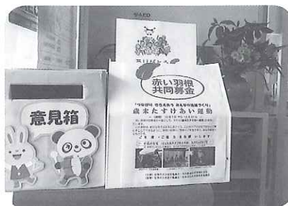
募金箱設置(保育所)