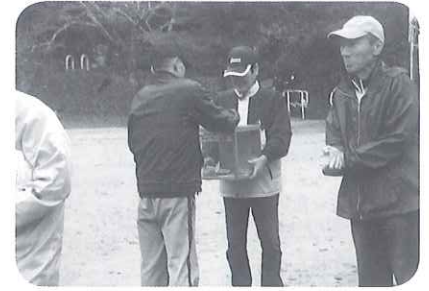
滝上グラウンドゴルフ西部地区