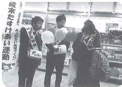
市内高校生による街頭募金