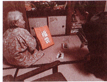
(障がい児・者支援事業)