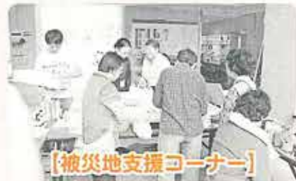
【被災地支援コーナー】