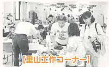
【里山工作コーナー】