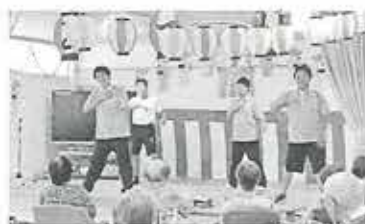
▲光台おどろう会から「ひよっこ」さんも参加 (左) AKBの曲に合わせて踊る高校生 (右)