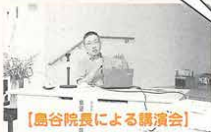
【島谷院長による講演会】