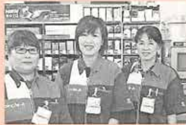
いつも笑顔で対応されています。

地域の高齢の方などがお店で重いものを買いたい時など、後からご自宅までお届けされているサービスもあり、店長さんはじめ、アルバイトの方も一丸になり高齢の方などが安心して買い物できるお店づくりをされています。