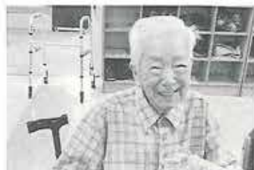
▲たこ焼きと一緒にノンアルコールビールを一杯