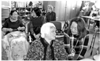
傾聴ボランティア「たんぼぼ」