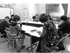
テレフォンボランティア定例会の様子