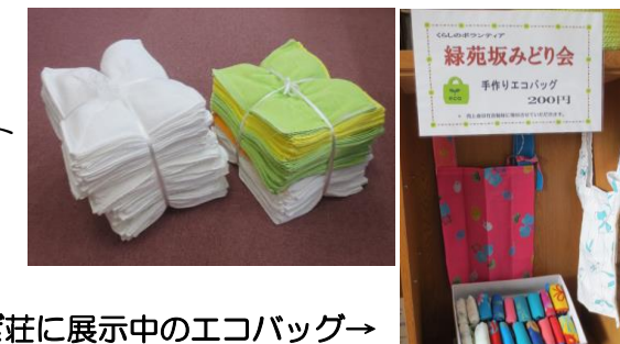
やすらぎ荘に展示中のエコバッグ→

ぞうきんが社協に届くのはこれが4度目で、今回も町内の福祉施設へお渡しする予定です。