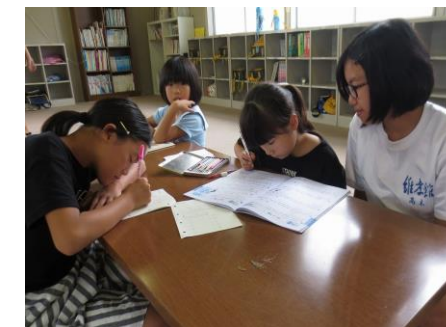
昨年の元気っ子クラブ