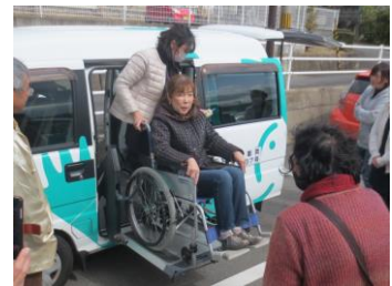
3月、運転ボランティア連絡会にて、技術の講習