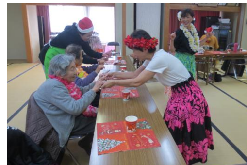
12/12、耳の不自由な方14名の参加。 クリスマス会でフラダンス