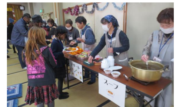
12/21、8家庭22名の参加。 手づくりバイキングの目玉は薪ストーブで焼いたピザ