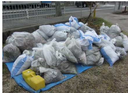
昨年のごみ、草落葉 350kg 土砂 470kg