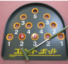
↑郷之口 ふれあいサロン スカットボールで 気分すかっと!