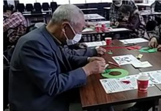
奥山ふれあいサロン(クリスマスリース作り) 家にこもりがちだったけど、みんなと話したり遊んだりできて楽しかった。