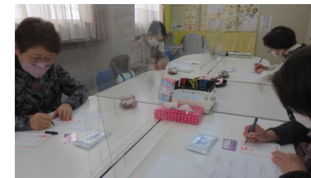
公募ボランティアさん4名による宛名書き作業

3つどい代替事業で嬉しいプレゼント! 12/13・14 わかば会(一人暮らし高齢者)53件 12/23・24 一人親家庭10件 ふれあい(障害児)12件