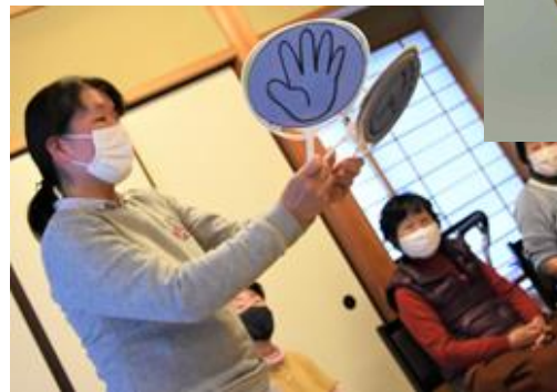
↑緑苑坂サロン会 千支(寅)の 色紙作り