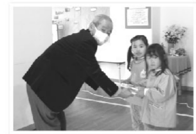
子ども達の「心の豊かさ」を育むために、「社協文庫」として町内にある17園・校(*)へ本をお届けしています。 ※令和4年度実績

町民の皆さまには、社協会費にご協力いただきありがとうございます。この会費は、貴重な財源として児童から高齢者、障がい者まで幅広い福祉サービスに活用させていただいております。