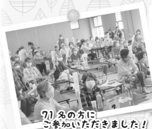
71名の方に ご参加いただきました！

与謝野町社会福祉協議会では、例年70歳以上のおひとり暮らしの高齢者の方々を対象とした「ひとり暮らしの集い」を開催してまいりましたが、ここ数年はコロナ禍でやむを得ず休止となっておりました。しかし今年、令和5年6月17日(土)に岩滝ふれあいセンターにて、実に 4年ぶりに開催 することができました！