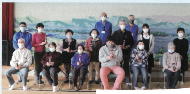
みんなでハイ★ポーズ!

短い時間でしたが、楽しい時間を過ごしていただけたのではないかと思います。来年度もご参加お待ちしております!