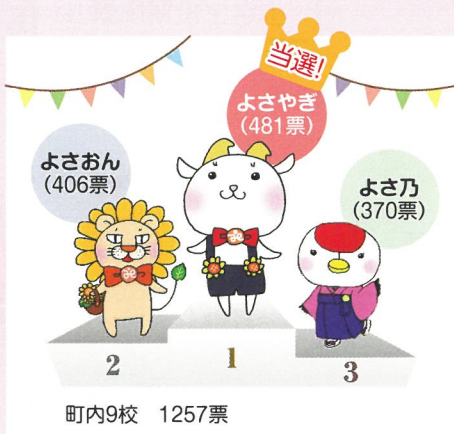
社協マスコットキャラクター「よさやぎ」

投票理由には「“バッグにお手紙(やさしさ)てんこ盛り”が良い」「僕の“やさしさ”も届けてくれそう」「みんなから預かった“やさしさ”を届けてくれるのが良い」等が多く“やさしさ”を配達する点が有権者の支持を得たようです。