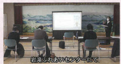
岩滝ふれあいセンターにて

令和2年12月2日(水) 岩滝ふれあいセンターにて今年度は、各社協においてWEB上での動画配信開催となりました。初めての試みの研修会でしたが、利用者の意思に寄り添った支援に携わる生活支援員として、相談援助の基礎を学びました。