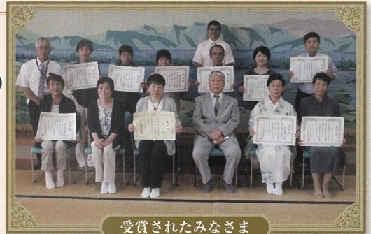
受賞されたみなさま