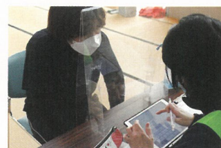
被災された方からの相談も、タブレットで入力しました