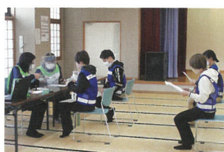
受付コーナーにて受付