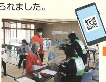
当日は、受付コーナーでメールで届いたQRコードを見せるだけ!