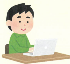
活動日までに、スマホ・パソコンで事前に登録

今回の訓練では、スマホやパソコンからの事前登録によりセンターでの受付票記入をなくす等、ICTを活用することでセンターでの滞在時間を減らす成果が得られました。