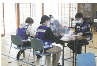
ボランティア受付票記入

従来だと、ボランティアがセンターへ到着してから受付完了までの時間等、被災者支援に出るまで一定の時間がかかることが課題でした。