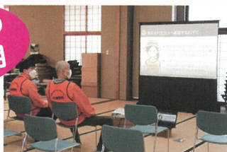
待機時間中に、活動するうえでの注意事項などの動画を視聴