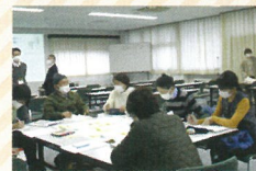
グループワークの様子...