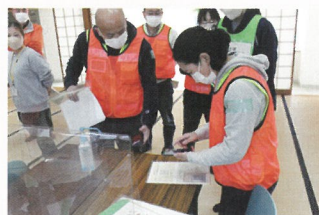
活動報告もスマホで…。