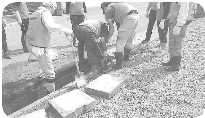
与謝野町ボランティアによる側溝の泥上げ

総勢29名の参加で、側溝の泥上げや、浸水家具の片づけなどの作業に従事していただきました。ボランティアのみな様には心からお礼を申し上げますとともに、被災されました方々に対しましては1日も早い復旧をお祈りします。