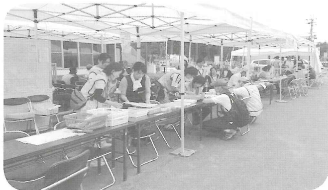
職員の災害ボランティアセンター支援