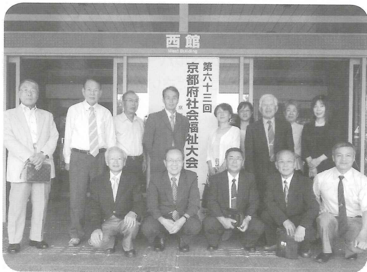
大会会場前で受賞者と社協役員のみなさん