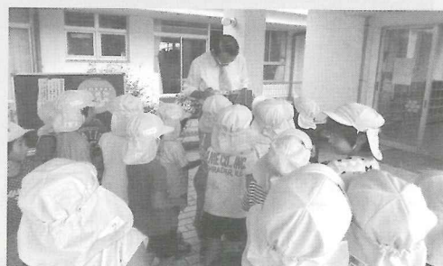
子供たちに紙芝居を披露（北風社協会長）

本・絵本は子ども達の「心の豊かさ」を育むための発育、発達に大きくかかわりますので、読書に親しみ、いろいろなことに興味を持っていただけたらと願っています。