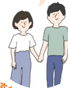
京都市みぶ学園の場合