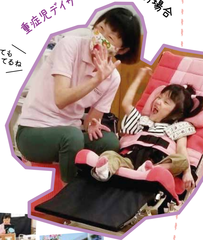
重症児デイサービス KOKO の場合