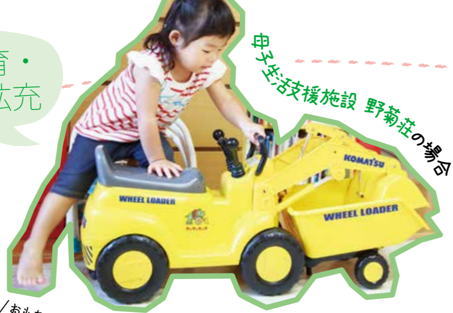
母子生活支援施設 野菊荘の場合