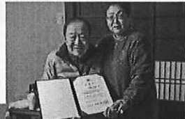
〈写真〉委嘱状を手にする京都府認知症応援大使の皆様