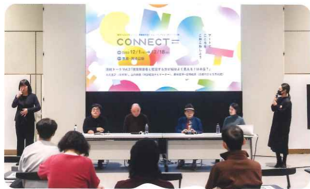
画像：昨年度の開催風景