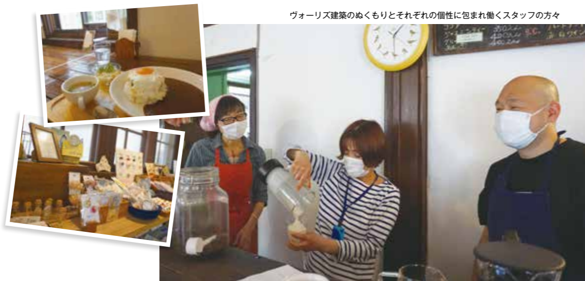
ヴォーリス建築のぬくもりとそれぞれの個性に包まれ働くスタッフの方々