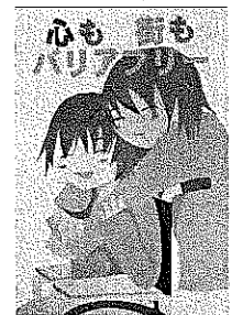
【心も街もバリアフリー】 京都府立綾部高等学校2年 北野 冨佳